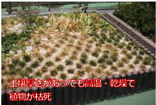
土壌厚さがあっても高温・乾燥で植物が枯死