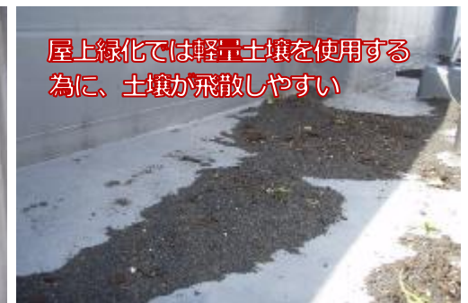
屋上緑化では軽土壌を使用する為に、土壌が飛散しやすい