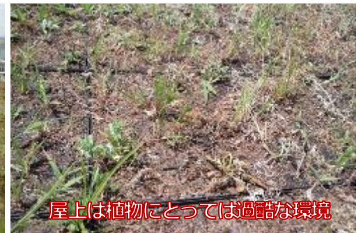
屋上は植物にとっては過酷な環境