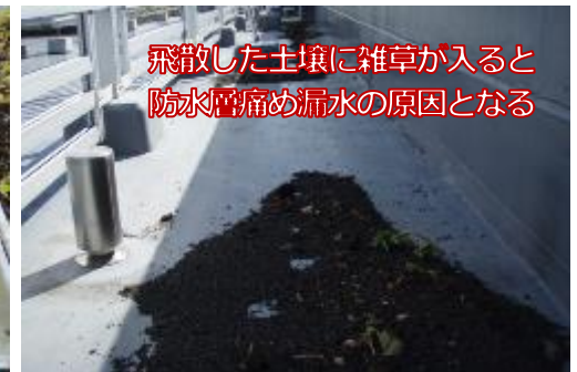
飛散した土壌に雑草が入ると防水層痛め漏水の原因となる