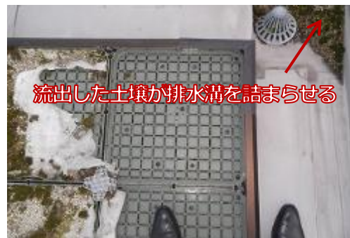
流出した土壌が排水溝を詰まらせる