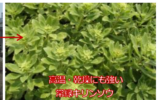
高温・乾燥にも強い 常緑キリンソウ