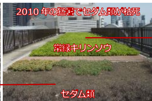
2010年の猛暑でセダム類が枯死