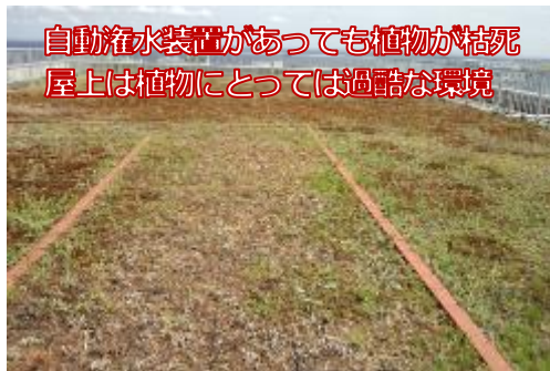
自動灌水装置があっても植物が枯死 屋上は植物にとっては過酷な環境