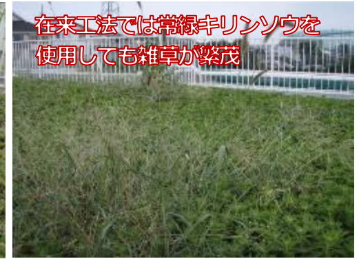
在来工法では常緑キリンソウを使用しても雑草が繁茂