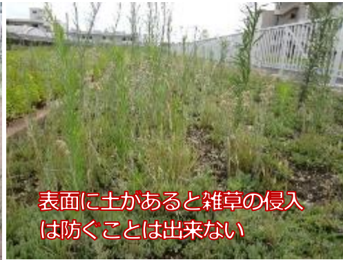
表面に土があると雑草の侵入は防ぐことは出来ない