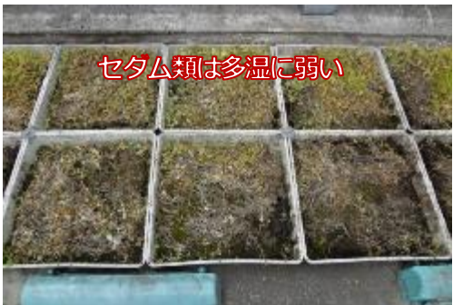
セダム類は多湿に弱い