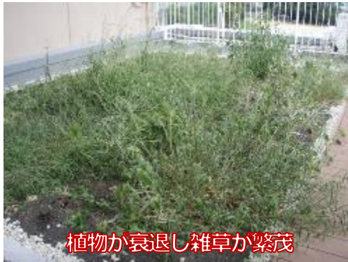
植物が衰退し雑草が繁茂